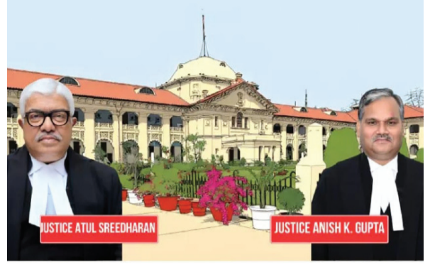
सकता है, यहां तक कि क्रिमिनल केस के लिए भी।"