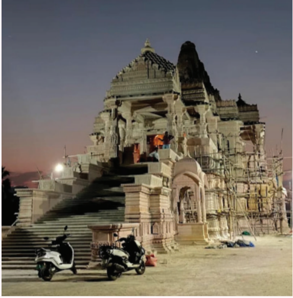
एवं उनके कर कमलों द्वारा पट्टा जा रहा है कि परम पावन धाम महाराज के सानिध्य में महायज्ञ अयोध्या में निर्मित मर्यादा